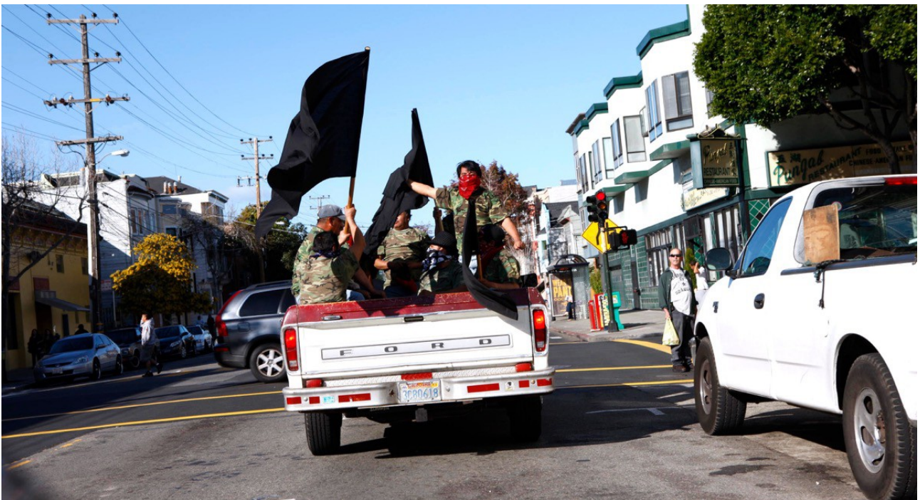
Photo: Hans Hs Winkler, Buy a Revolution , Intervention, San Francisco, 2010

Öffnungszeiten/Opening hours: Do-Sa/Thu-Sat: 15:00-18:00