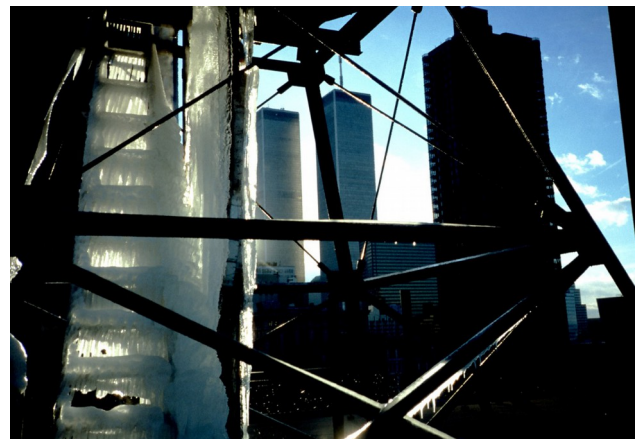
Photos: Links/left: Die Reise nach Kaho'olawe/Journey to Kaho'olawe , Intervention, Hawaii, 2018 Rechts/right: New Yorker Eisleiter/New York Ice Ladder , Intervention, Manhattan, 2001