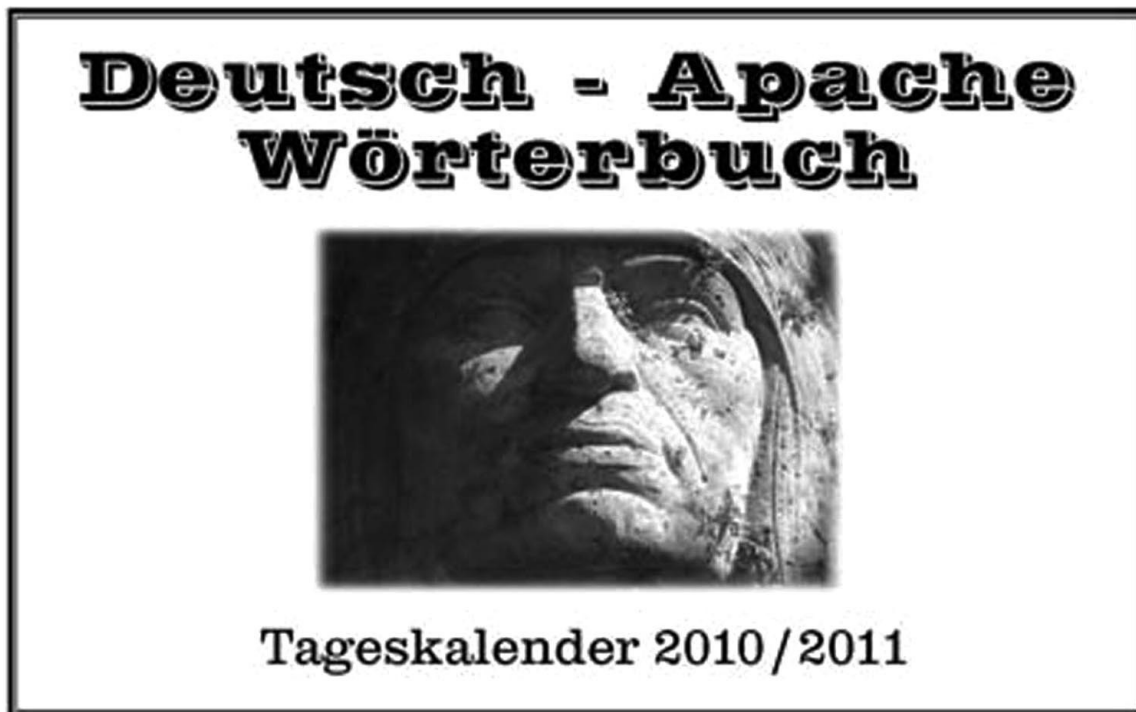
Photo: Apache-Deutsch-Wörterbuch für drei Gefängnisse ( Apache-German Dictionary for Three Prisons ), Intervention, Chemnitz, Zwickau, Waldheim, 2010